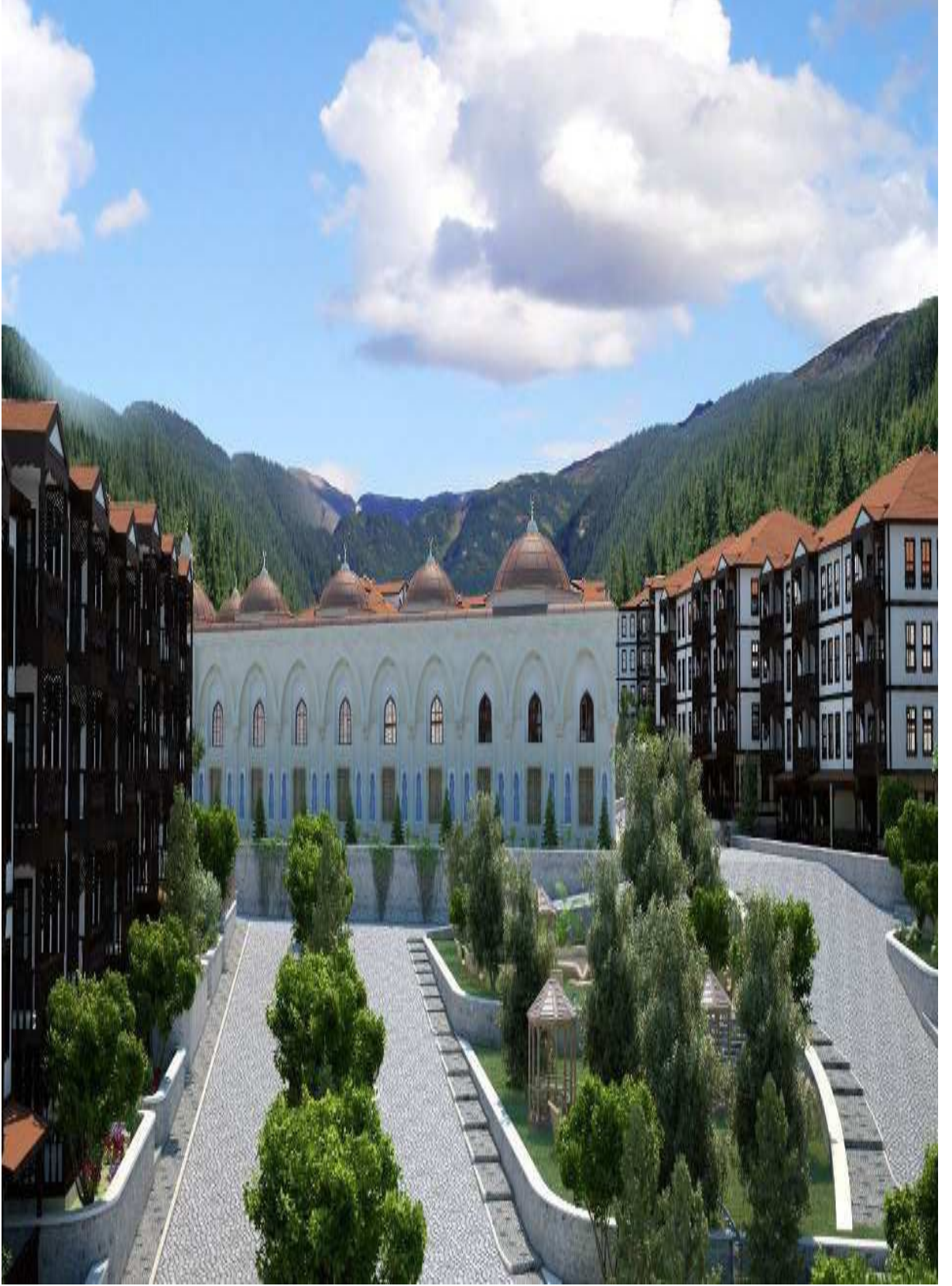
Şekil-1: Taraklı Termal Turizm